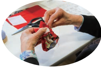
和布細工での飾りづくり講座