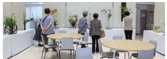
4つの生け花サークルが交代で参加