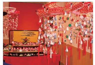
和布細工飾りの作品展示

田上町を知ってもらおうきっかけや、田上町の新たな魅力を発信する取り組みを実施しております。椿寿荘では大広間で、町内各家庭から寄付していただいた3段、5段、7段、親玉飾りをはじめとした、ひな飾りを展示し、枯山水の園庭とひな飾りのコラボレーションは「和」を存分に味わう事が出来て、とても素敵です。道の駅たがみにおいては、入口や食堂の天井に花や動物などをかたどった手芸品のつるし雛を約2500個展示し、買い物や食事を訪れる方々の目を楽しませてくれます。そして、田上町交流会館（公民館）では、町内の小学生、高齢者施設を利用する方々、交流会館で活動するサークルの皆様が作成した、色とりどりの折り紙のつるし雛が、施設をとても華やかに飾ります。