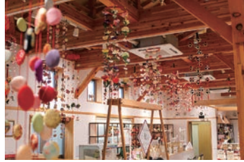
ひな飾り（道の駅での展示）