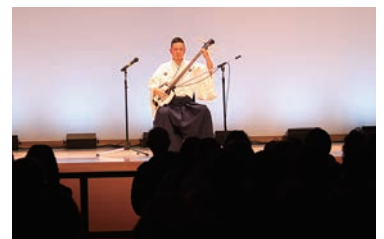
田上町交流会館コンサート

取り組んでおられ、素敵なるつるし雛を完成することが出来ました。また、ひな巡り期間中には、「田上町交流会館コンサート」を開催し昨年は、交流会館で初めて津軽三味線による演奏を行いました。津軽三味線の代名詞である「津軽、しょんがら節」をはじめ、ひな祭りにちなんだ曲等を町内外の多くの方から楽しんでいただきました。