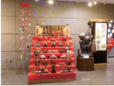
ひな飾り（交流会館での展示）