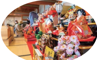
ひな飾り（椿寿荘での展示）