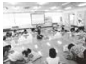
ママと赤ちゃんのための教室

認知度が増してきたとはいえ、参加いただけるまでにはまだまだ、結局のところは直接の声掛けが続き、連絡方法は自分自身の携帯メールやLINEアプリを使いました。そのたびに、事業の細かい説明を一人一人にしているのが、負担といえれば負担でした。そこで... (3) SNSを利用した周知・発信(LINE@の活用) SNS:ソーシャル・ネットワーキング・サービスの略。インターネットや携帯回線を通じてオンライン上で不特定多数の人が交流をはかるサイトの総称で、「情報の発信・共有・拡散を目的とした機能を持ちます。例えばFacebookフェイスブック(ツイッター)インスタグラムLINE」。