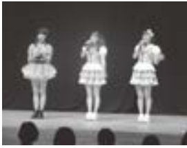
ビビットリングとラビンス

栃木県さくら市氏家公民館で実施した「夏休み公民館自由学校」の講座の一つであった「アイドル養成講座」を修了し、現在「ご当地アイドル」として活躍している2組のステージ発表がありました。