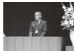
千葉県公民館連合会演崎会長あいさつ

・千葉県公民館連合会演 崎会長より 来年度の全国公民館研究大会・関東甲信越静研究大会千葉大会については、令和2年11月19日(木)～20日(金)に船橋市民文化ホール、船橋市中央公民館等で開催すると紹介がありました。