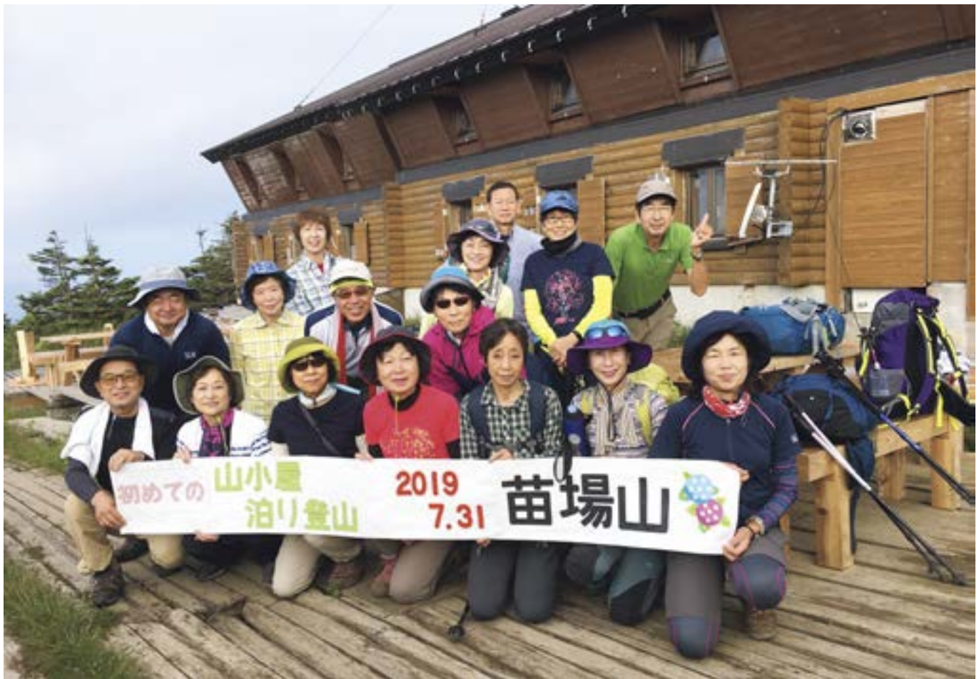
「初めての山小屋泊まり登山」講座(柏崎市) 講義もトレーニングも事前準備は万全! 苗場山、全員登頂しました。