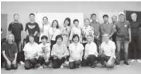
ふれあいコンサート実行委員会

高齢化が進む湯沢町において、出演サークルメンバーも例外ではありません。ただ「年齢を重ねた今、このコンサートで年1回ステージに立てることが人生の糧になっている。」と仲間と共に練習