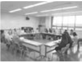
運営委員会 全体会

西新潟オープンカレッジは、1年を上期と下期に分け、4〜5回の講座を設定しています。公民館も支援をしますが、企画から運営までオープンカレッジが主体となって進めています。