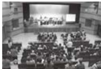
コンサートフィナーレ会場と一緒に歌う