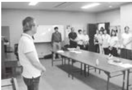
来年に向けての反省会

に励み、いきいきと日々を楽しんでいます。また音楽未経験の方々が公民館講座をきっかけにサークルを立ち上げ、このコンサートをはじめ、イベントや発表会等に出演し、積極的に音楽普及活動をしています。今後もコンサートを通じて町民の輪、生涯学習の輪が広がるお手伝いができると感じています。来年に向けての反省会