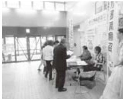
説明会にてアンケート調査を実施

平成28年から29年度にかけて、学びの郷南魚沼プランの策定・検討を実施しました。平成29年度には出来上がった学びの郷南魚沼プランの説明会を市民向けに開催しました。説明会当日は、受けてみたい講座などについてアンケート調査も実施しました。