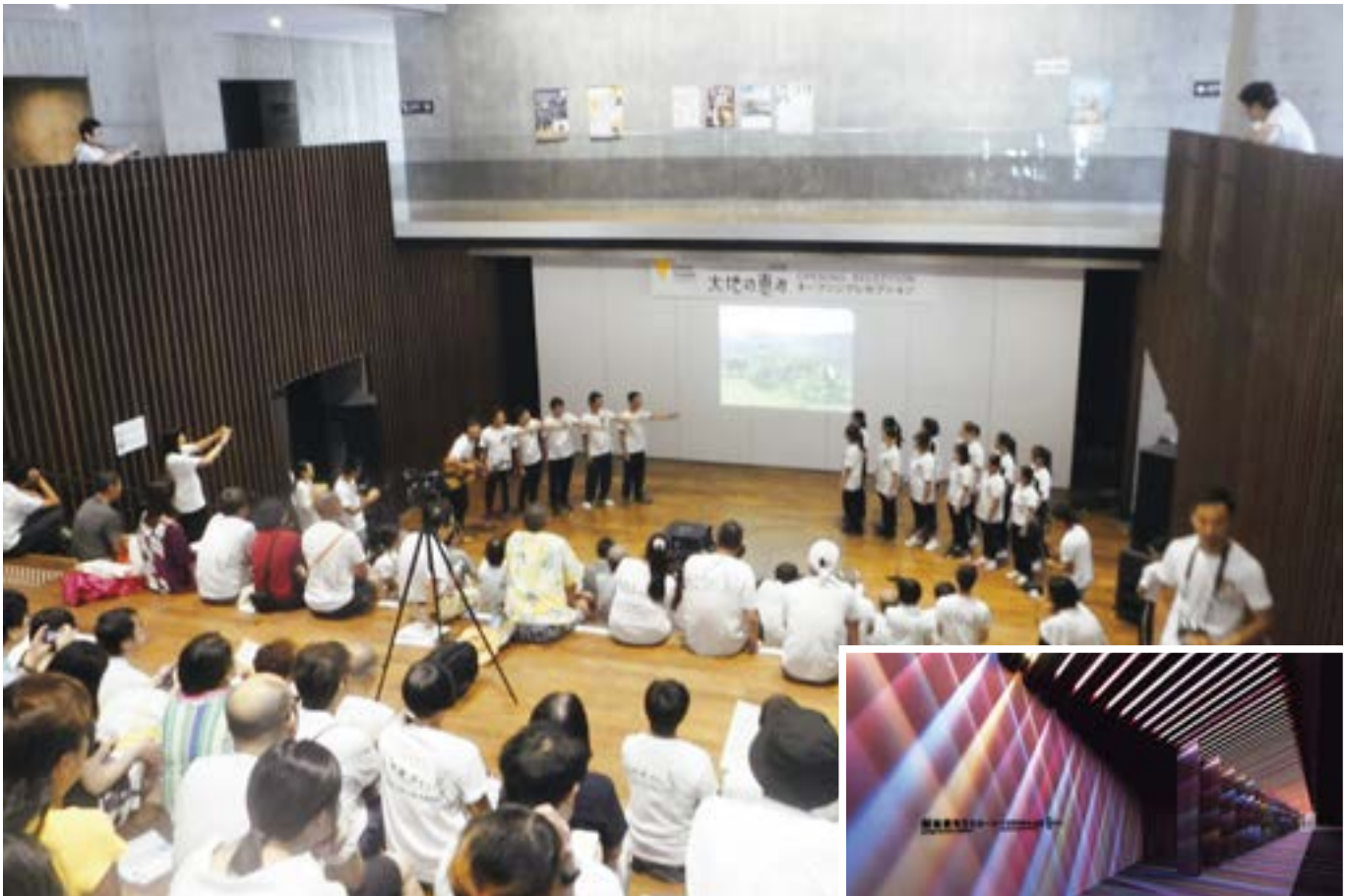
7/29～9/17に開催している大地の芸術祭の作品「大地の恵み」(公民館で展示)のオープニングレセプションの一コマです。