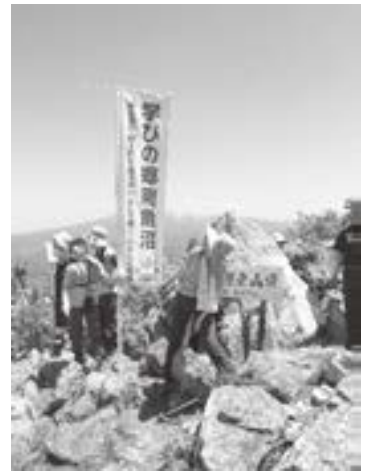
下権現堂山頂にて

の方から参加いただきました。子どもも大人も声を掛け合い楽しみながら、無事登頂することができました。