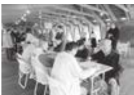
フリー将棋対局の様子

足腰が痛くて歩けないがまちあるきには興味があるという市民を対象に入ライドを見ながら、座ったままでまちあるきの楽しさを感じていた