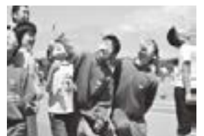
子どものパン喰い競争

地区を創る人々の愛と力を基盤に行政等と連携し、地域づくりの拠 点としての公民館創りを進めていきたいと思います。