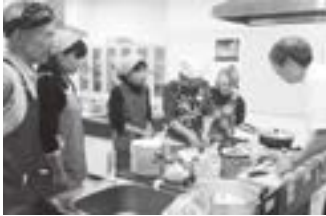
おつまみづくり講座

公民館利用者からレクダンスをやってみよう。この声を受け、3回シリーズで企画した講座で