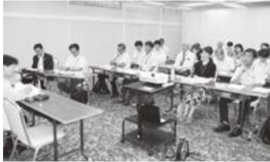
参加者のみなさんです