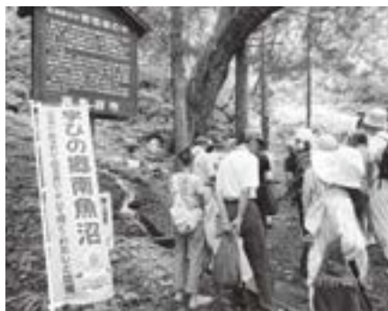
新潟県名水「雷電様の水」を見学

南魚沼の名水を始めとして、地域の宝を再発見することを目指し、夏休み期間に実施しました。当初、県内の小学生の参加を見込んでいたが、中高年からの申込みも多くあり世代間での交流も図れました。