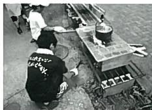
屋台メニューづくりに挑戦