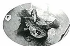
釣ったアジをその場で南蛮漬けにして食べました。