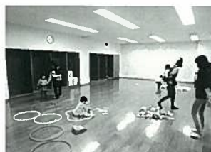
プレールームでリズム体操

幼児と保護者の活動の場と機会を提供し、幼児や親同士の交流や、仲間づくりの支援をしています。昨年度は、こいのぼりや七夕飾りなどをつくったり、段ボール迷路やシャボン玉・水風船などで遊んだりしました。