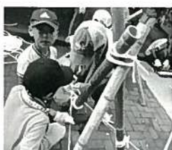
自分たちでつくった竹の台でそうめん流し