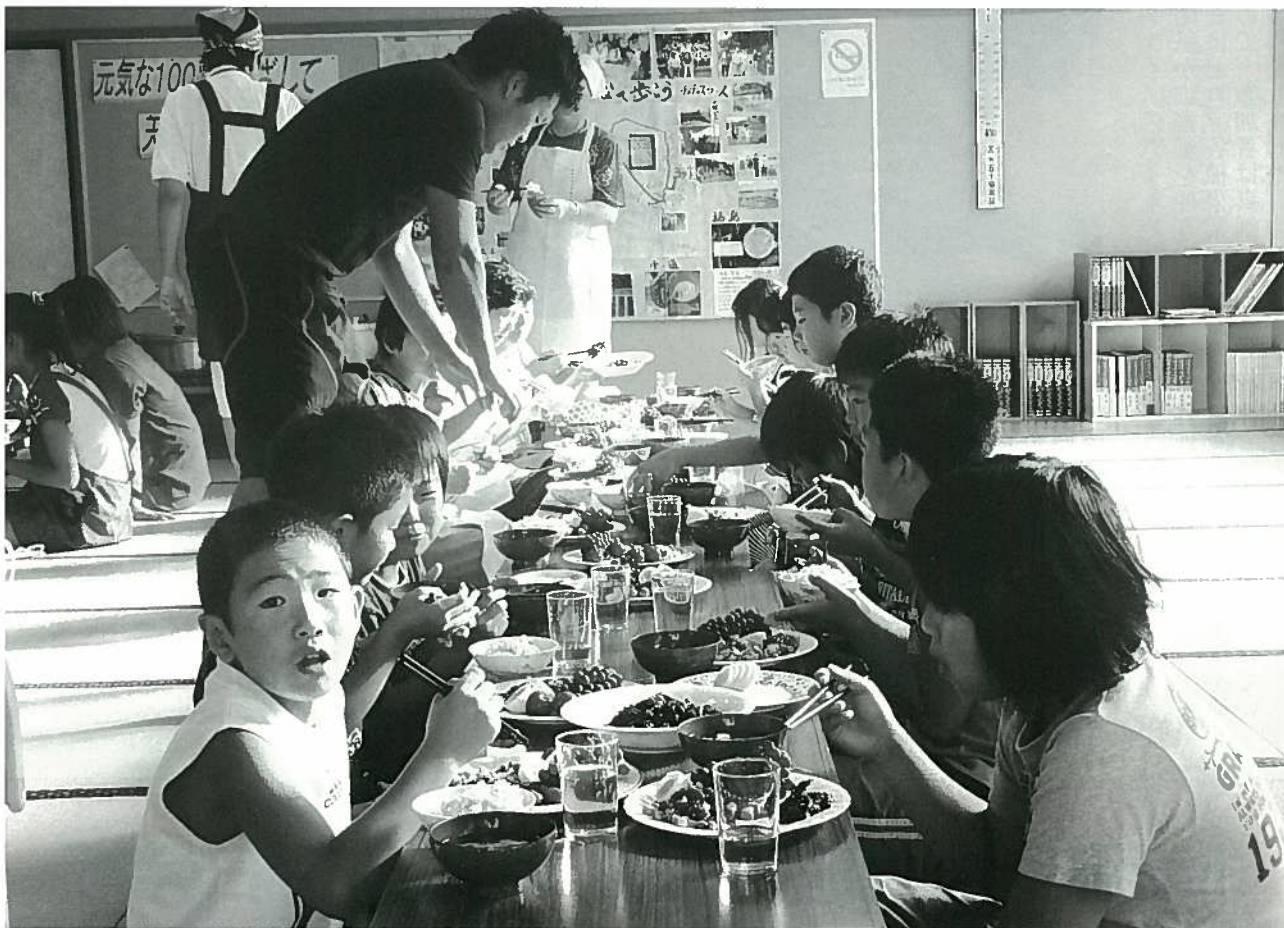
親元を離れ「公民館合宿」(チャレンジ真木山キッズ事業)～新発田市～