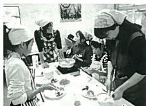
楽しく料理する親子

小・中学生と保護者を対象に、親子で一緒に料理をつくる機会を提供し、親子の交流を深めています。親が包丁の使い方や材料の切り方などを子どもに教える姿や料理しながら楽しく会話している姿が多く見受けられました。