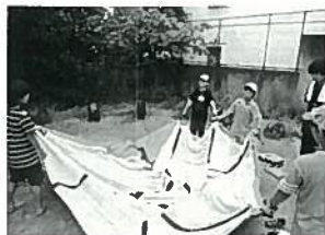
自分たちでテント設営

テント泊や海遊び、カレーや屋台メニューづくりなどの活動を通して、参加者同士の交流を深めて楽しい夏の思い出をつくります。昨年度は、銭湯体験やきもだめしも行いました。