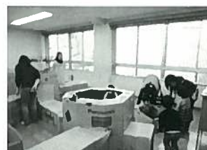
段ボール迷路で親子遊び