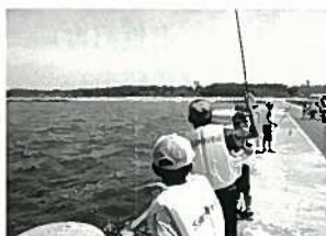
昼食材料の魚釣り

失敗を恐れずに、様々なことに挑戦し、たくましい心を育てることをねらいとしています。昨年度は、火おこし体験やそうめん流し・魚釣り・浜焼きなどに挑戦しました。