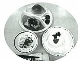
できあがった料理