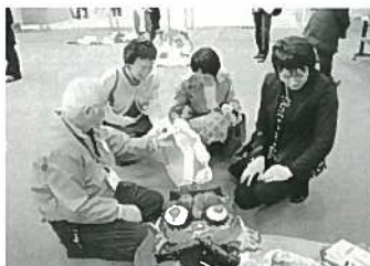
見附市が実施した 防災キャンプの 様子も紹介

子ども会の方々から、子どもたちが楽しめる工作の紹介や、長年の活動経験に基づく子どもたちへの思いを聞かせていただきました。