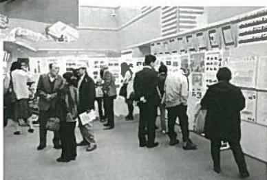
「へえ～新聞紙と ザルできて いるんですね！」