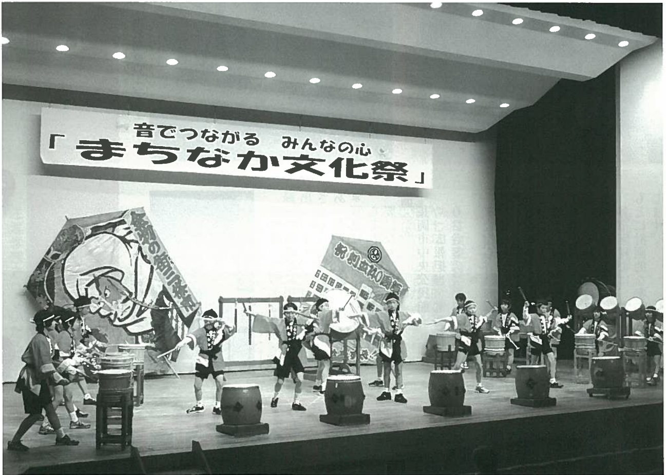
まちなか文化祭 (三条市)