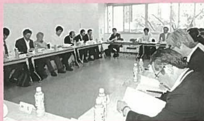
前年度第1回評議員会 (新潟市中央公民館)