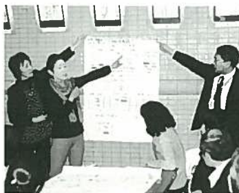
グループごとに発表