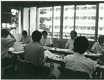
検討委員会の様子

討しました。その結果、平成22年度実施の国勢調査における市町村人口確定値(23年10月公表予定)に基づき、従来通りの計算方式で賦課金を算出することとし、市長会、町村会にお願ひし了承されれば、平成24年度から改訂された賦課金をお願いすることになりました。賦課金の金額は試算したところ、従来の金額と大きく変動しない予定です。試算した新しい賦課金については、10月頃に、各市町村公民館会計担当者にお知らせする予定です。