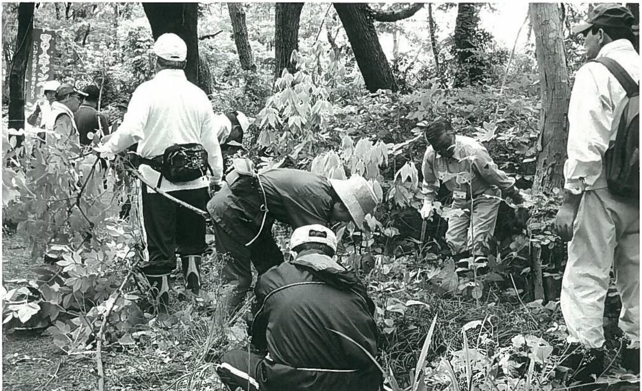
新潟市・海岸保安林を守る ボランティア養成講座