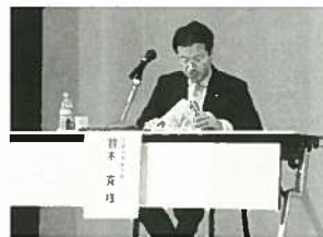
鈴木 寛氏 (文部科学副大臣)

文部科学副大臣の鈴木 寛氏が「地域主権と社会教育」と題して基調講演を行った後、次の方々にシンポジウムを行いました。