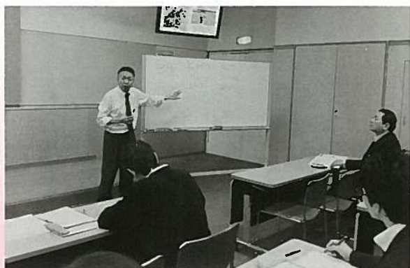
魅力的な公民館報づくり

修が行われた。公民館報の批評や撮影法、取材の仕方などが講義され、多くの事例を紹介するとともに、参加者同士で取材をし、記事を作成する実習を行った。