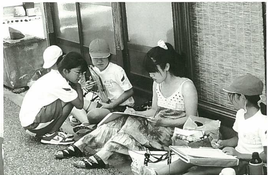
東京芸大生による スケッチ画講習会（出雲崎町）