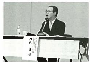
神代 浩氏 (国立教育政策研究所長)