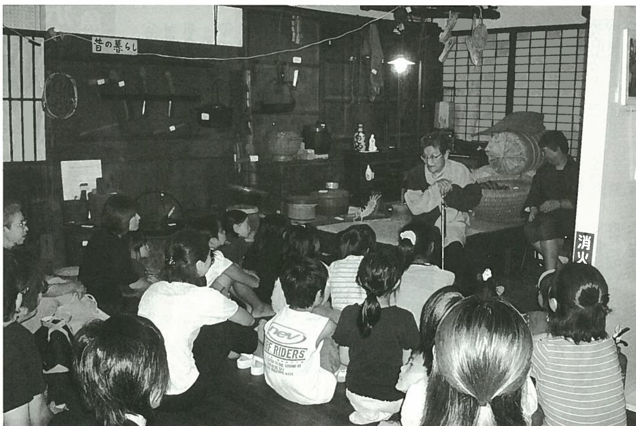
家庭教育かるかも隊 「第8回真夏の昔話の会」 加茂市