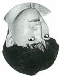
(社)全国公民館連合会事務局 次長 村上 英己