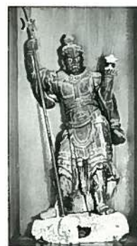
「山岳信仰の寺趾と仏像」 宝光院(弥彦)に安置されている 龍池寺遺像多聞天像