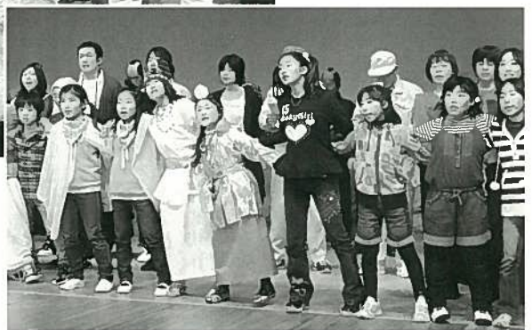
刈羽村生涯学習センター ラピカ 開館10周年記念事業演劇発表会 「砂の丘に生きる」