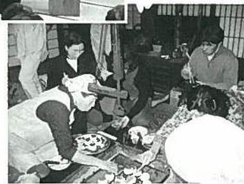
「岩室の郷土料理」 いろいろある風景から けんさ焼き