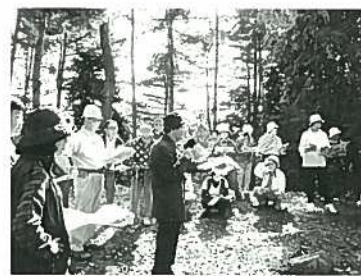
「古墳をめぐる」 縄文の暮らしにロマンを 求めて