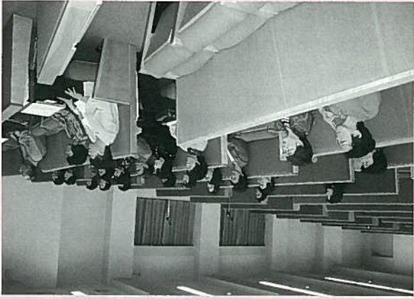
へえ～虫歯ってあんなふうにできるんだあ (日本歯科大学にて)