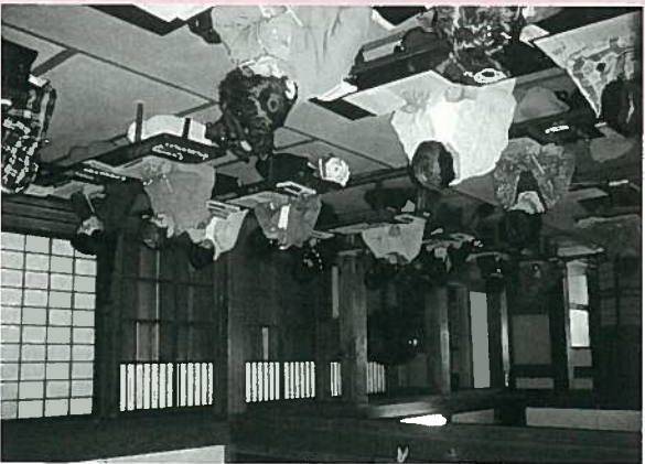
ほとんどの方が初めの写経 丁寧に、丁寧に…(慈光寺にて)