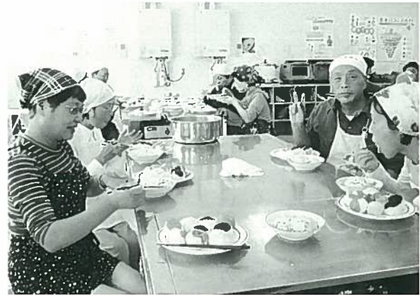
ラップっていろいろ使えるねえ。 簡単におもてなし料理の完成!

30人定員の講座であるが、いつも定員を上回る申込みになる。フィールドワークは、仲間づくりのきっかけとして必ず1回目に入れているが、今回は普段経験できないことであり、いい体験になったようだ。受講生が一番興味をもっていたのは、食品偽装が話題になっていた時期でもあり、2回目の「食品業界裏話」であった。実際取引があった会社からのお話は納得する正確な情報だった。最後に、医師から論理的に楽しく話を聞くことで、健康についての締めくくりとして知識がまとまり、自分なりの健康観を持たせた。