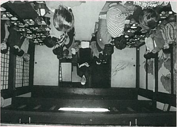
朝食のメニューを試食 手が込んでいておいしい！(慈光寺にて)