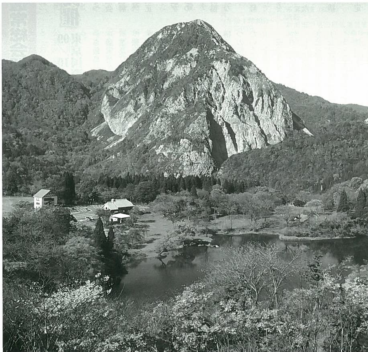
糸魚川ジオパークの一つ高浪の池

表紙解説 糸魚川市は世界の地質遺産などの中から優れた集合地域をユネスコが認める「ユネスコ世界ジオパーク」をめざしています。