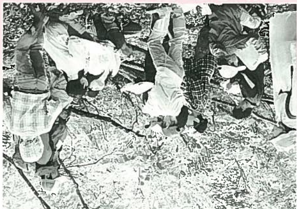
6/14(土)の第1回は、群生するツナギの中をハイキングしながら、植物の生態を学習しました。ツナギの幹に聴診器をあて、水を吸い上げている音を聴くとともに、ツナギの地面の土と、街の土との違いについても学習を深めました。

プロジェクト内の一つの事業は、学校教育の「学校」に対して「楽校(かっこう)」と見立て、その内容や目的から、「雪」や「海」、「里」といった象徴的な単語を楽校名に用いています。 教育委員会生涯学習推進課を中心に、各区分室や水族博物館、小林古徑記念美術館などから、職員がこのプロジェクトに参加しています。なお、事業名は、「養」を重んじ地域の産業を興し、人材を育成した地元の武将：上杉謙信公にちなんで名づけられました。事業の詳細や企画・運営にあたって工夫している点など詳細は、平成21年3月に、新潟県公民館連合会が発行した『公民館事業・講座実践事例集』に掲載しておりますので、こちらを参考にしてください。