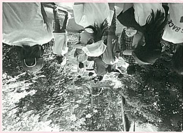
8/2(土)・8/3(日)の第3回は、森の中で1泊2日のキャンプです。班に分かれて、テントを張ったり、食事を作ったり…。翌朝は、夜はナイトハイクで星や虫の鳴き声の当てっこです。翌朝は、仕掛けておいた虫かごで、カブトムシを見事に捕まえました。