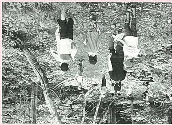
7/12(土)の第2回では、小雨が降る中で、森の中から聞こえてくる色々な音を地図に記入して、サウンドマップを作りました。また、次回キャンプに使う灯籠も、ネットホルダーを作りました。