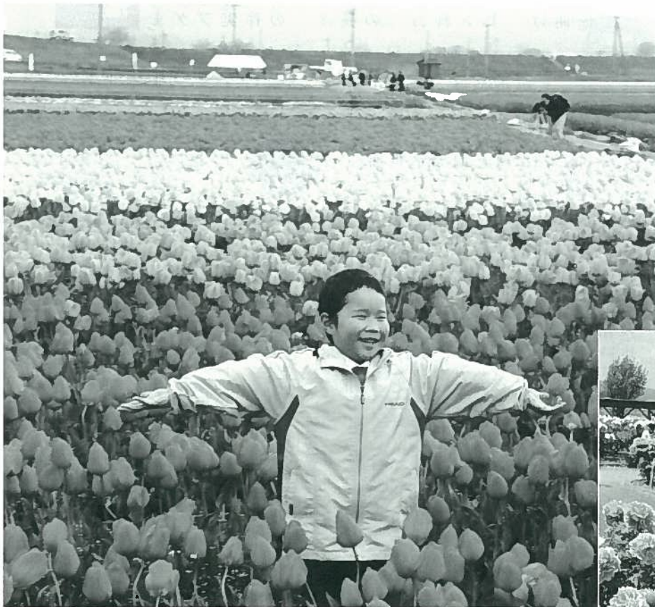
巢本のチューリップ畑