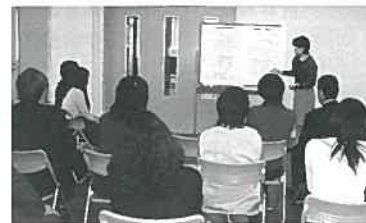
新潟市の新任職員研修の様子

公民館職員は、仕事柄市民から相談を受けることがあります。相談の内容も講座の企画や講師の紹介、利用団体の紹介、果ては、講座の受講