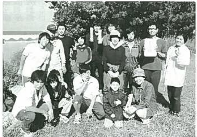
▼グランドゴルフ大会を終えて