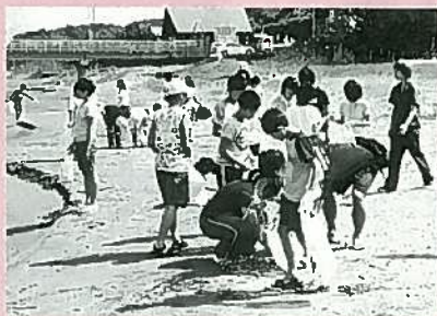
「海岸のクリーン作戦」 「たくさんのゴミがあるね」

クチャー、塩作り、貝工作、海釣り、クリーン作戦、海水浴等の体験から海と人間との関係、