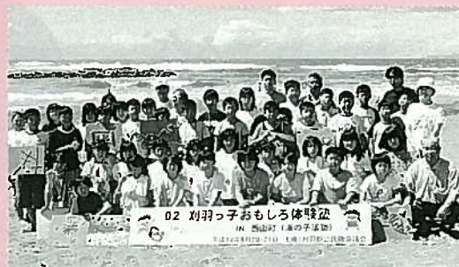
参加者全員でハイチーズ!