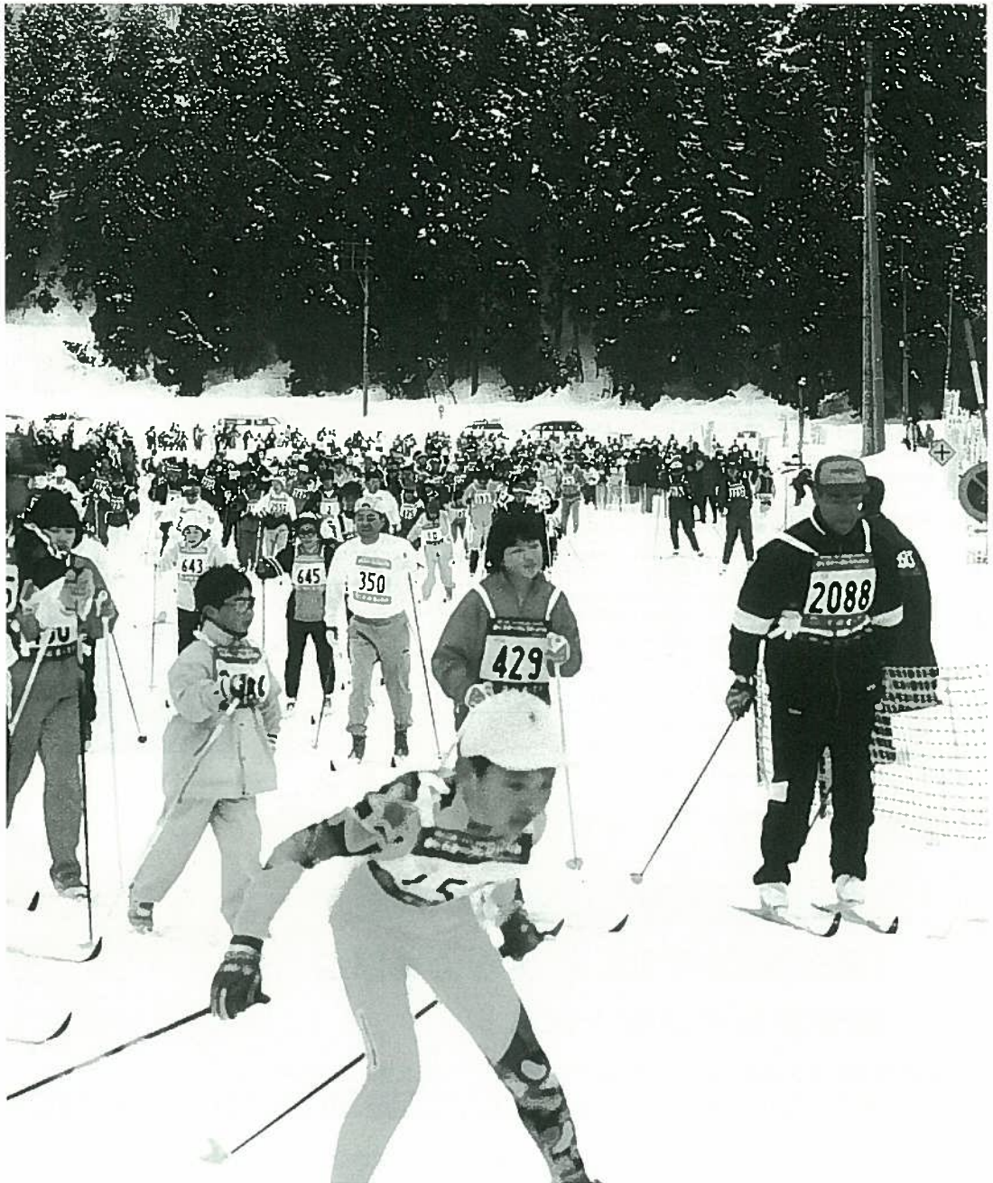
「にいがたむいかまち 歩くスキーフェス ティバル」