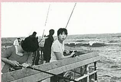
海釣りに挑戦、「何が釣れるかな？」

刈羽郡公民館協議会では、「広域ネットワークを充実し地域間の公民館事業及び青少年の相互交流を図る」ことを研究目的として、先進地視察、講演会等の研修やわが町1コマ写真展、青少年交流事業等の交流活動を推進しています。