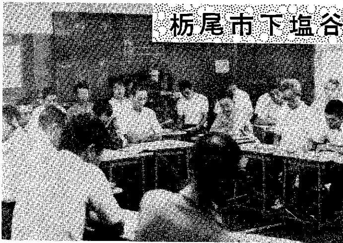
くり返す話し合い、そして実行

栃尾公民館は八つ、五十人を対象にして社会教育の一に勤め、専業農業は少ない。の分館があり、上塩谷、端谷となっている。分館、上塩谷分館で一つの地域をなして、私たちが地域の地域は専業農業であったのが、最近では兼業農業にかわり、約十三日世帯、主婦もほとんど工場(織物工場)を簡単に記してある。