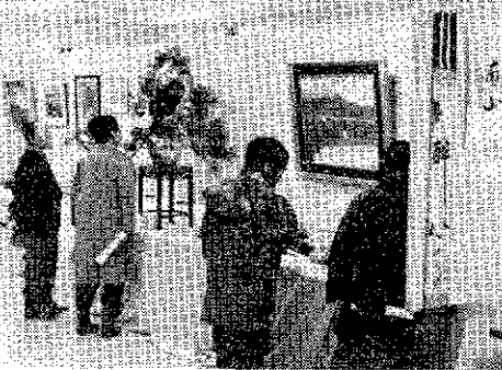
(柏崎市長寿者趣味展)

展」と「長寿者趣味展」を実施しているが、全市の婦人学校や婦人団体、高年齢教室や老人クラブの交流交歓の場となり、又、全市公民館活動のデモストレーションの機会ともなっており、市民の公民館活動への認識を新たにした。