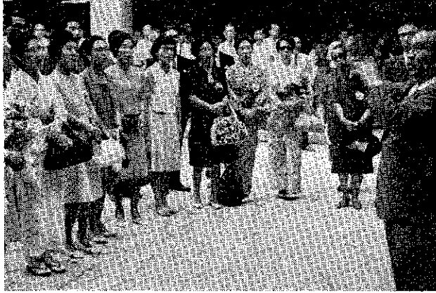
一行帰国後、市役所前でソ連の歌を合唱する一行

先般新潟市の文化室へ、書き綴って見ました。勿論短能使節隊を引率して、いっけの滞在であり、まじり連とソ連邦ハバロフスク市という超大型国のほんの北の端の一端を視察訪問いたしました。小都市の児童でしたからソ連の全たので、社会教育にた統をお伝えするものではありません。あらかじめの了解を得ておきずさわる場合に、少しでも外国軍情を紹介し上げて、何かの参考にして頂きたいと存じそこはかと(1)ともてつかい国であること。