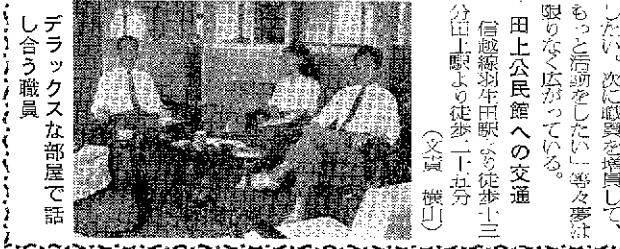
トラックスな部屋で話し合う職員

その活動の中でも、重点的にひらいてみると、青年学級の自動車運転コースは、五カ年間の学習で一応初期の目的を完了して、今年は開級したという。婦人学級は十六級の学級を、青年学級とプログラムを並み、実地での練習を重視して成果をあげている。 次に各地で開行する青年学級の多い中に、この村だけはまずまず回動も活発であり、広報などの内容を見ては相当高度のことがのべられてある。 もう一つここで力を入れているものには、田上村史の研究である。眼を見つけた館長自ら内を駆けめぐり、すでに中間報告も出された。