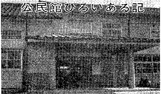
公民館ひろいある記