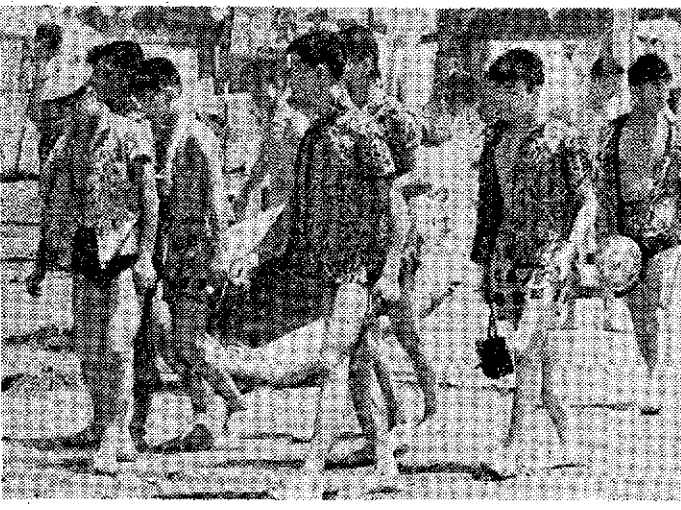
写真海辺にみる太陽族の生座

太陽族を中心に、十代二十代の青少年の生活態度がいろいろ批判され、それに関連して青少年教育や、社会の欠陥などが多方面から論じられたことは、別な意味からも意義のあつたことであらう。 この問題は既に發展して「映画の観覧禁止」「検閲制度の復活」「映画法制定」「条例制定」といつた面でも拡大されるに至つて芸術文化に対する官僚制といふことも世論の矢面に立つた。 まづ、中央に於いては、かかる不良映画対策が、次の三つのルー