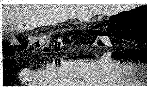
上は 県青少年野外旅行活動佐渡ドングレノコースにおけるキャンプ風景

青少年に長期の休暇期間、休日の時期に宿泊施設を利用して野外旅行活動を奨励し、大自然のもとに共に若い生命の躍動を感得する機会を与え、グループ活動を通じて健康増進、自然科学、生産技術の研究、社会性の涵養として人間性を高め、郷土を愛する精神を養い、地域青少年との文化の交流、健全な青少年育成は文部省が特に一、二年重点的に指導してきた青少年運動の一つである。本県でもこの運動に呼応してユースホステル運動の趣旨を立脚し、産業経済、文化財及文化施設、景勝地等を多分に含んだ三泊コースを地区委員会の推薦のものより、佐渡タカラ峰、シラネ、高原笹ヶ峰コース、清津峡苗場コース、守門道院コースを本年度は決定した。尚本コースにより野外旅行活動を実施するには宿舎の指定が必要である。この宿舎指定は文部省基準方針による佐渡郡西津丸旅館、西蒲原郡巻町竹野町令仙寺、角田妙光寺、妙高高原赤