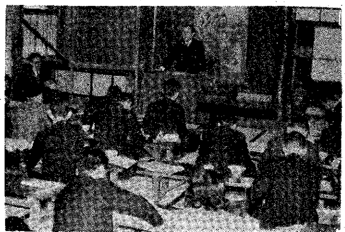
一上の写真はその会場

発行人 新潟県公民館連絡協議会 新潟市寄居町 越後自治会館内(電 2-7954番) 振替口座 新潟 4094 十二月号 (45号)