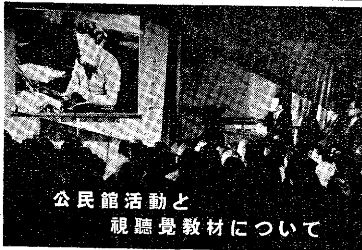
公民館活動と視聴覚教材について

例えは公民館に「原子力の方法をとり、その講演会に対する平和的利用」について講師を招いて住民の興味を喚起する努力がなされて講演会開催する一つの計画がなれるであろう。しかし学習として行われなければならない。勿論ボクスタその講演会を聞きながら、講演