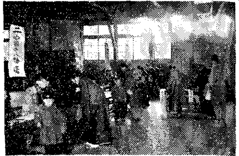
写真 今日公民館の主催による来年度学校に上の子供を連れての移行学級である。PTA活動とも母親学級ともつながるので、公民館は大した方の入り方である。

する場合、婦人団体のみでなくPTAとも密接な連絡をとることが望ましく、PTAにおいて母親学級を開設する場合や、小中学校とPTAとの共催で社会学級をもつ場合は、両者の連絡調整は、いよいよ必要である。なお、男子成人を対象とする成人講座、成人学級が、父親教育の意味をもつて多くの公民館で開設されることを望ましく、又、公民館に開かれる講演会、講習会、討論会、等は常にPTA会員の成人教育のために活用されるべきである。