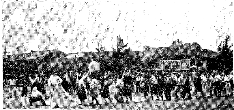
写真 町中の各成人がそろつての町民運動會、PTAの会長さん、婦人會の会長さん、このときばかりは、全くの重んじられておられる。……でもこゝから湧き出る力が

PTAを全く學校後援會と同視するが、PTAは児童、生徒の福祉、地域社會の建設である。公民館がしていることに堪へるのであり、「を願う父母と先生が、全く、自主、地域社會における社會教育の中心社會教育關係団体であるけれども、特別なものだから委員は考えない」というのは、一応、婦人團體であつて、兩者はまったく論議の上には不可欠の要素として