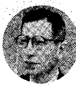
小杉の初旬、女教育の大切な人たちが