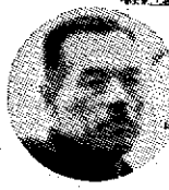
鹿野 社会教育が学校