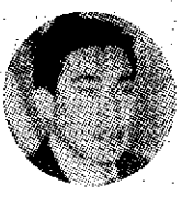
和村 村から職員に対しては満足な...