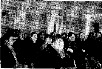
写真是新図書館開館式 室における視聴教育 育の実地研修